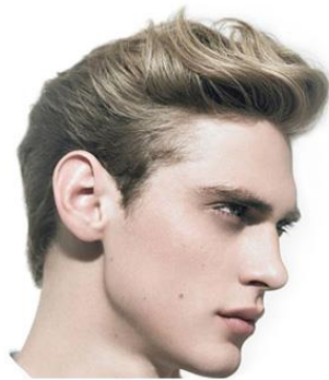
DIAGRAMA PARA PIEZAS DE SKIN: